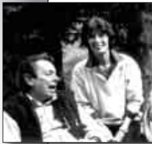
... "Quelli" che continuano.

sponde di laboratori appositamente attrezzati) e di storia dell'arte; mostre di pittura, scultura, grafica, fotografia, con particolare attenzione agli autori modenesi; conferenze con video-proiezioni e presentazioni di libri di autori modenesi in particolare sulla storia della città e della provincia; viaggi culturali e mostre all'estero per presentare gli artisti modenesi; concerti. Promuove mostre e incontri culturali per i giovani. Ha collaborato e collabora tuttora con Enti Pubblici e privati per la realizzazione di manifestazioni culturali in altri comuni ed in altre provincie italiane nonché scambi con città estere. A Modena con: Provveditorato agli Studi, Amministrazione Provinciale, Amministrazione Comunale, Istituto d'Arte "A. Venturi", Associazione Amici dei Musei e di Monumenti, Fondazione Cassa di Risparmio (mostre storiche), Fiera di Modena (organizza Fierarte in collaborazione con la Società Fiere), Modenanti-quaria, Premio giornalistico Città di Modena, Archeoclub, Associazione "La Trivela" per lo studio e la ricerca sul dialetto storico di Modena e provincia; varie associazioni di volontariato: Unicef, Croce Rossa, Avis, Misericordia,