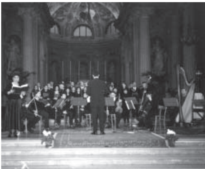
Coro e orchestra "San Francesco da Paola"