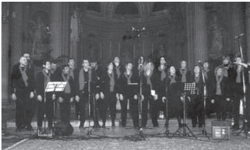
I Serial Singer