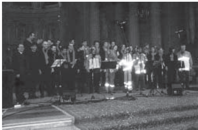
I Serial Singer alla fine del concerto con alcuni volontari della Misericordia